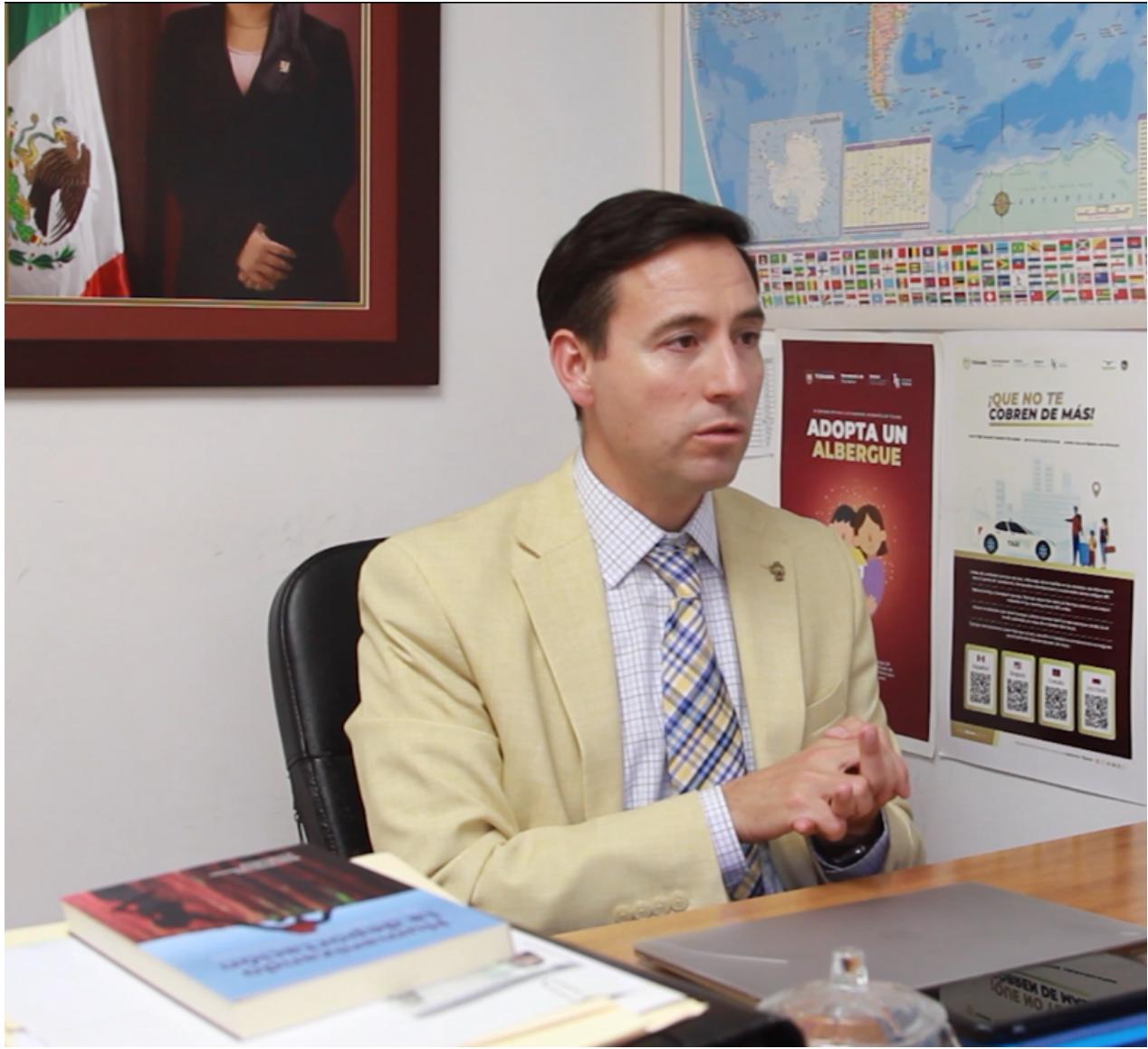
Entrevista con Director de Asuntos Migratorios en Tijuana

Se diseñó un cartel visual con un vínculo mediante código QR a una aplicación de diseño gráfico digital.