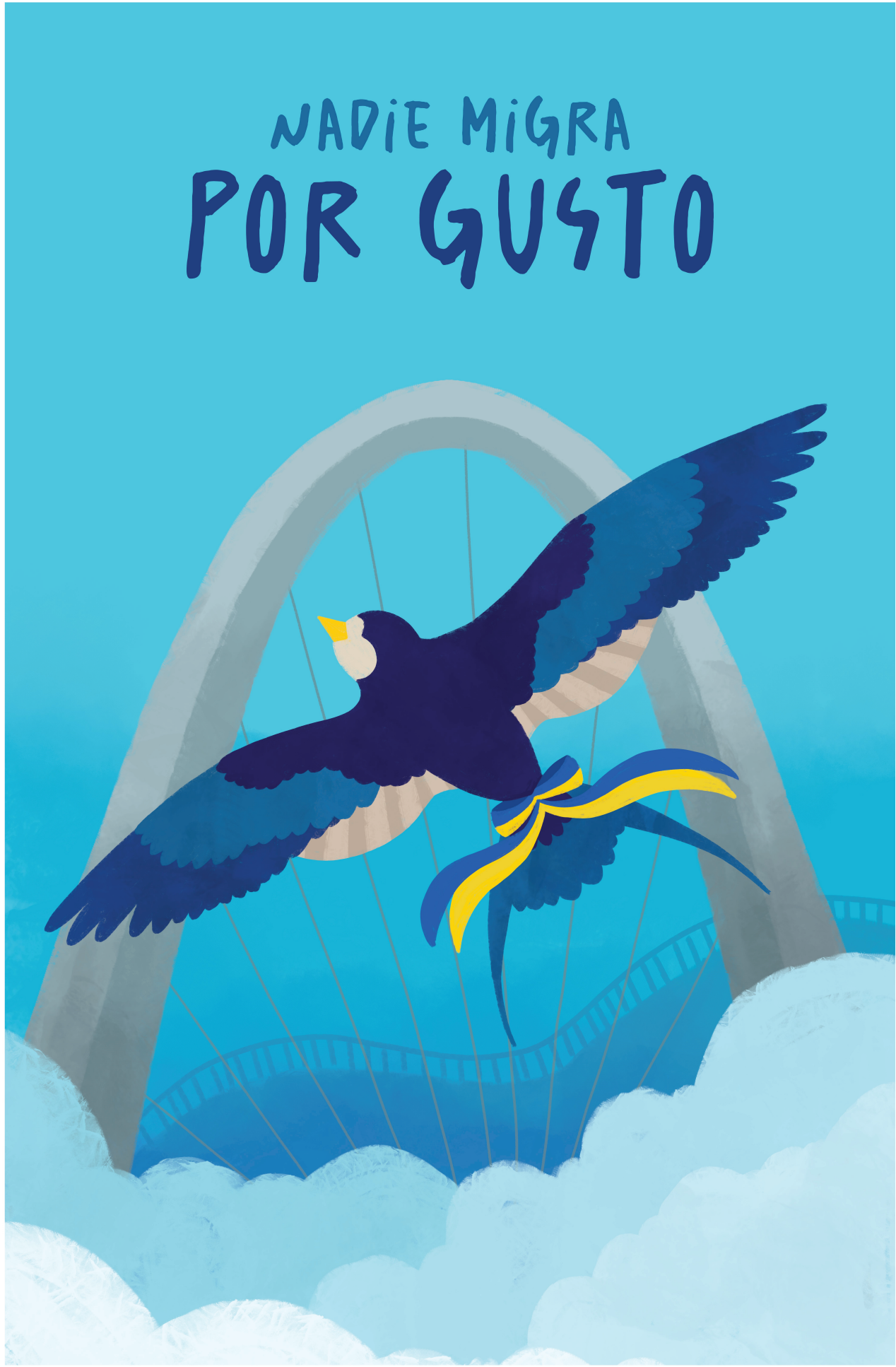
Cartel promocional del documental "Entre fronteras".