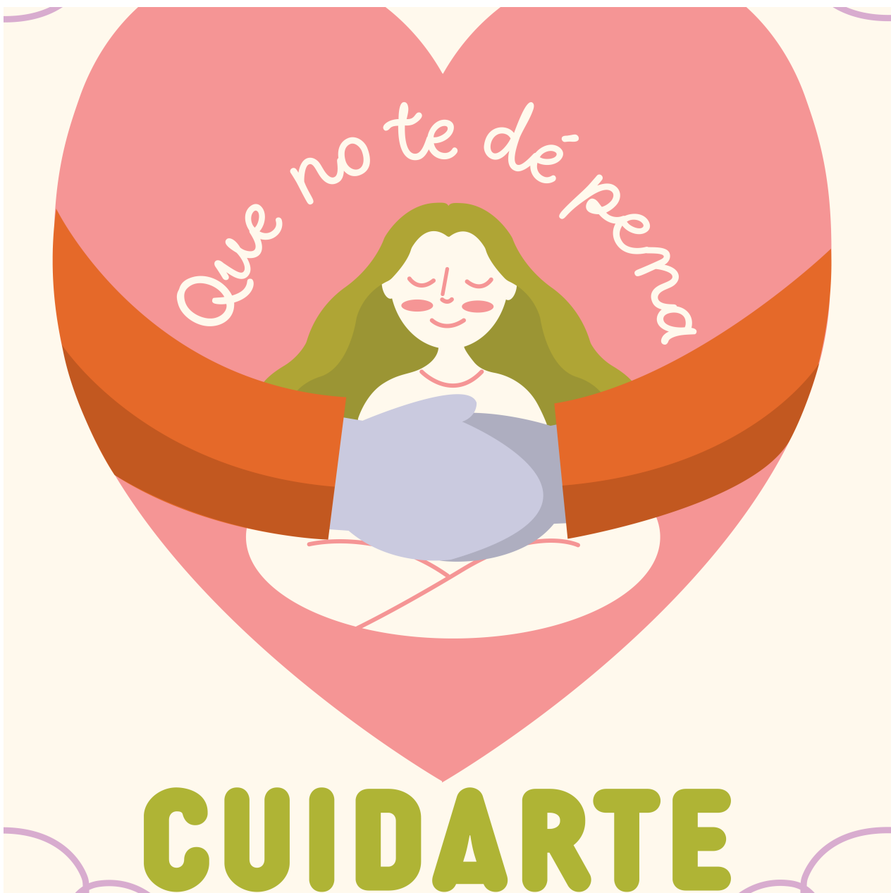
Diseño de cartel que promueve la salud femenina