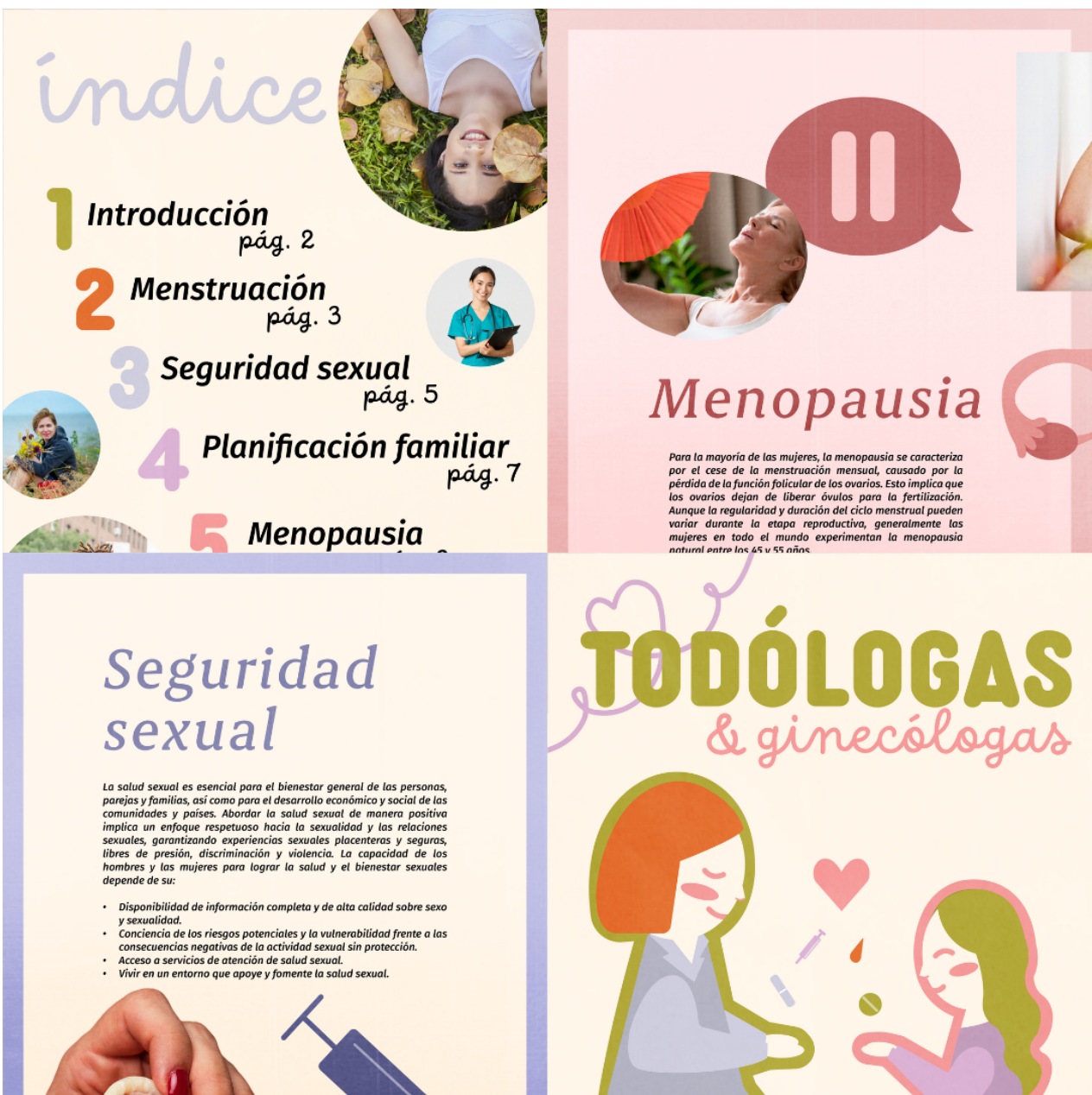
Páginas realizadas para la revista “Todólogas y Ginecólogas” como parte de la aplicación de diseño