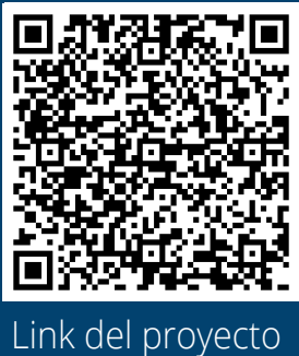
Link del proyecto